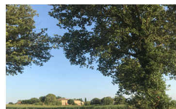
Chêne remarquable route de Bel Air

Ceci nous permettra de préserver notre patrimoine culturel et historique, par exemple pour les vieux muriers et de préserver notre paysage avec des chênes centenaires et les autres arbres emblématiques du Piémont cévenol.